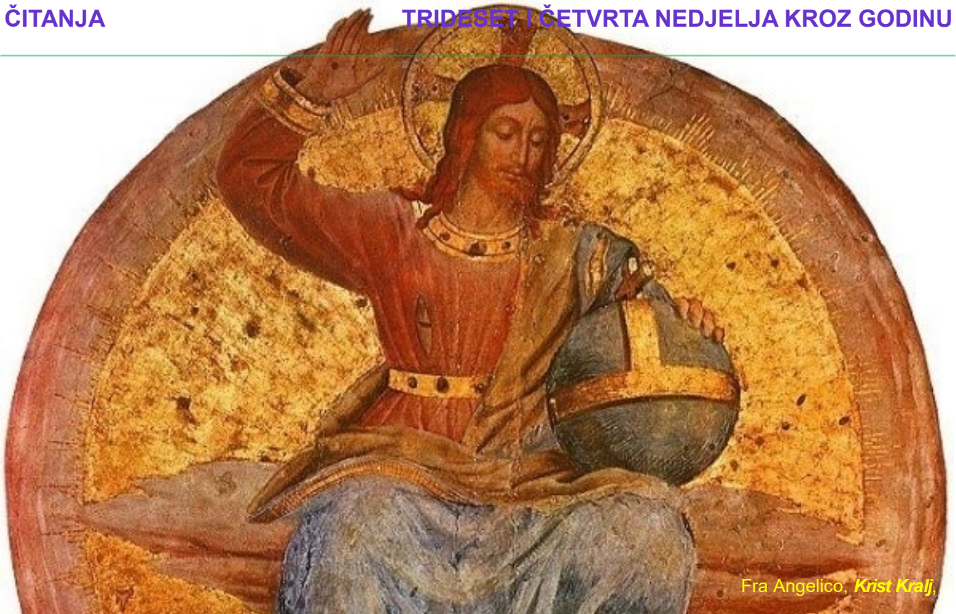
Fra Angelico, Krist Kralj ,

Sud nad narodima zaključni je odlomak Isusove eshatološke besjede. U njoj je na svoj način sažeta esencijalna poruka Evanđelja. Na slikovit način Isus govori o sebi kao pastiru, kralju i sucu koji razlučuje zle od dobrih. Svi koji slušaju taj Isusov govor nalaze se u odlučnom trenutku da spoznaju istinu o Isusu i o samima sebi.