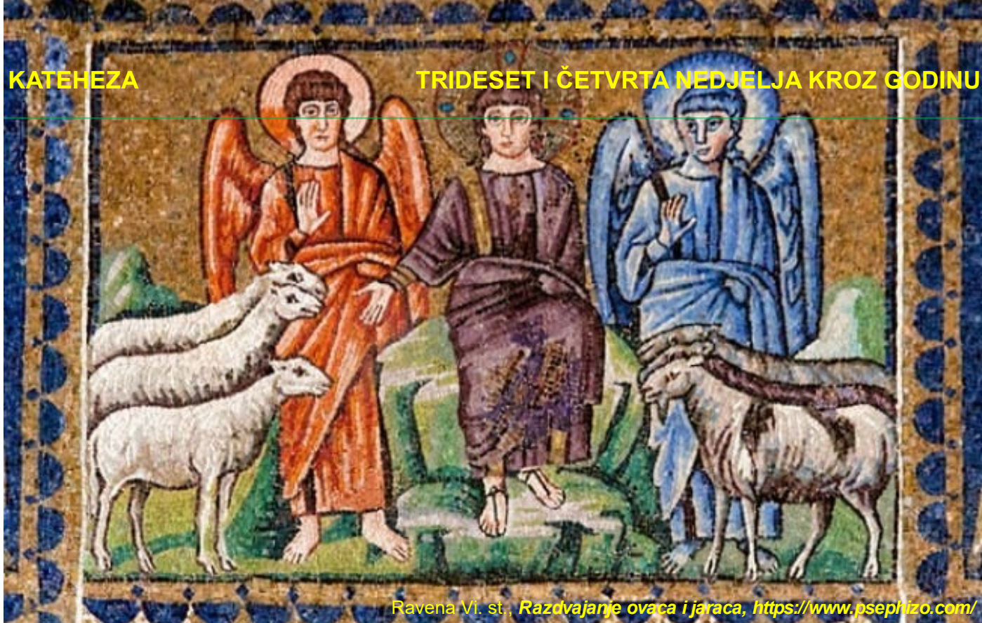
Ravena VI. st., Razdvajanje ovaca i jaraca

Prije uzašašća Krist je ustvrdio da još nije čas slavne uspostave mesijanskoga kraljevstva što ga je Izrael očekivao, i koje je, po prorocima, imalo svim ljudima donijeti konačni poredak pravde, ljubavi i mira. Sadašnje je vrijeme, po Gospodinu, vrijeme Duha i svjedočenja, ali i vrijeme još obilježeno „nevoljom“ i kušnjom zla koja ne šteti Crkvu i započinje borbu posljednjih vremena. To je vrijeme iščekivanja i bdjenja.