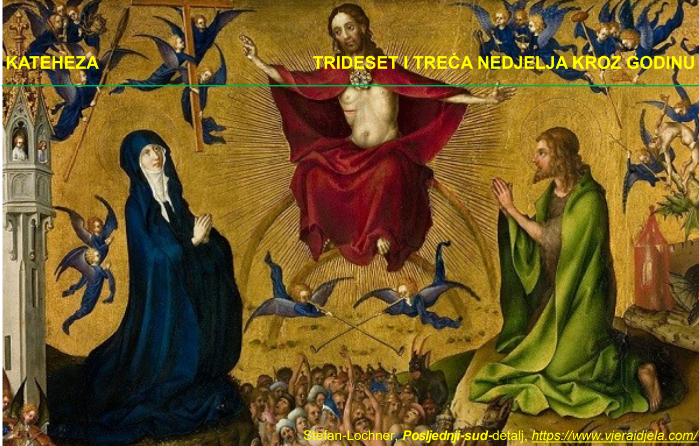
Stefan-Lochner, Posljednji-sud -detalj