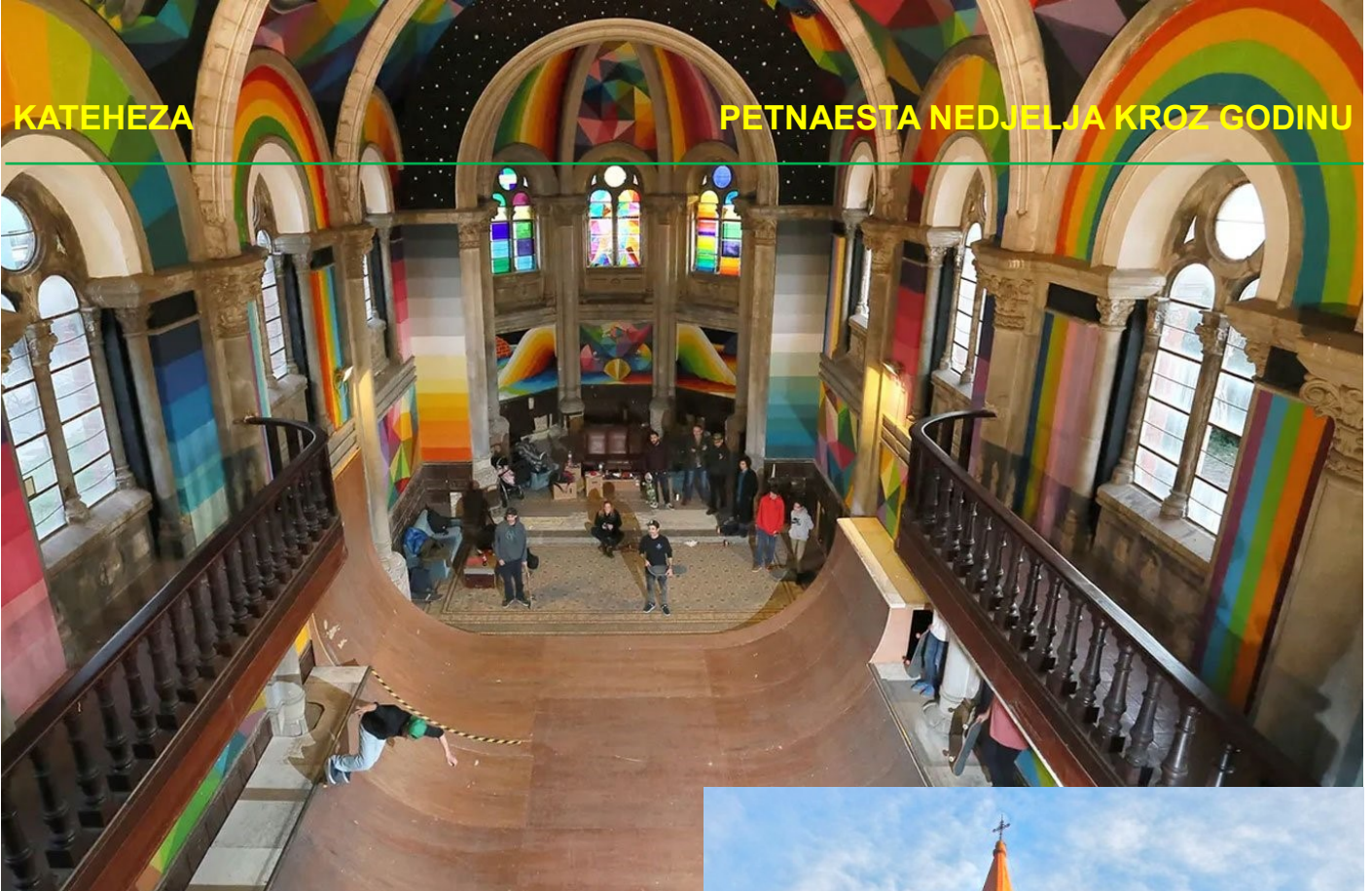
Crkva svete Barbare U Llaneri, Španjolska pretvorena u skate park, https://www.churchpop.com

toga, u jednom trenutku pomislio: Bože, koliko li je velika bila darežljivost kršćana koji su svojim prilozima omogućili da ovaj Božji dom bude podignut! Kolika je njihova ljubav prema Bogu kojemu su u čast podigli ovaj veličanstveni hram kako bi ga ljudi u njemu slavili! I koliko je velik broj Božjih poštovalaca koji su se ovdje okupljali. Posebice stoga što to nije bila jedina velika crkva koju smo našli u tom gradu.