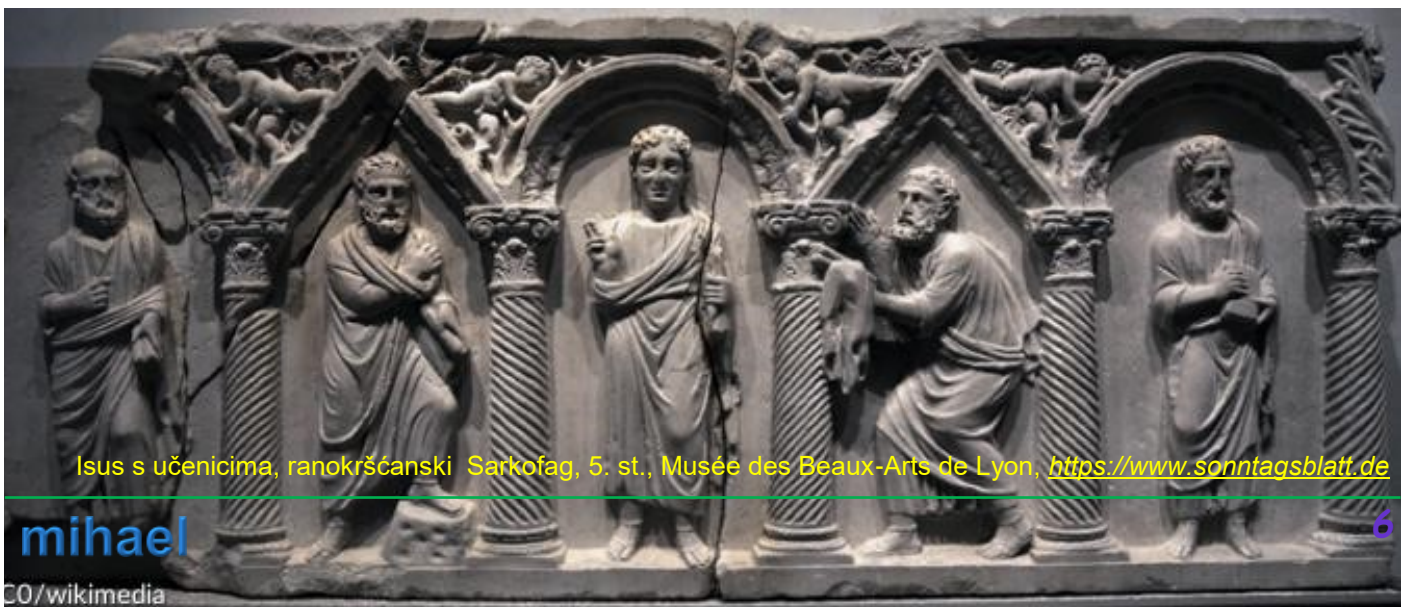
Isus s učenicima, ranokršćanski Sarkofag, 5. st., Musée des Beaux-Arts de Lyon