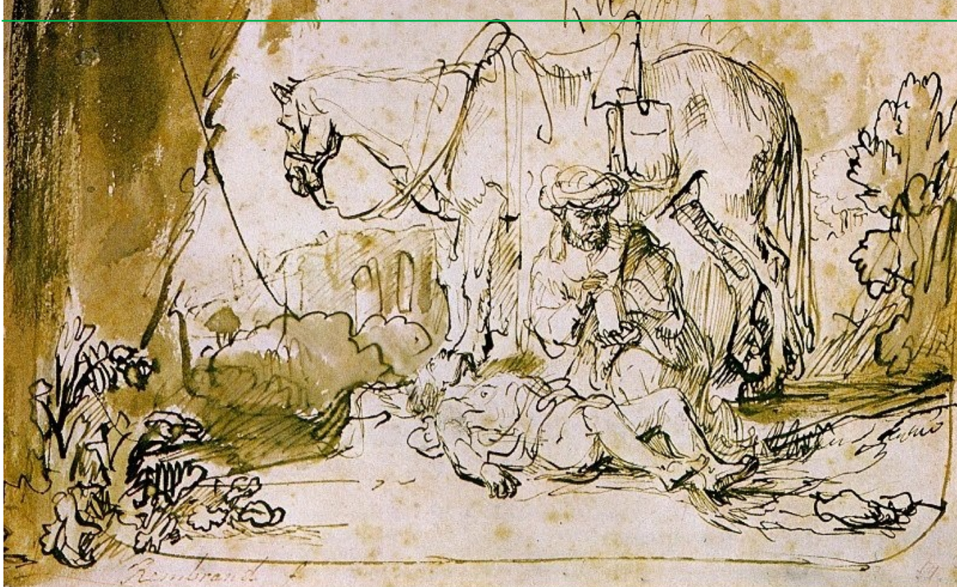
Rembrandt van Rijn, Milosrdni Samaritanac, https://www.artbible.info