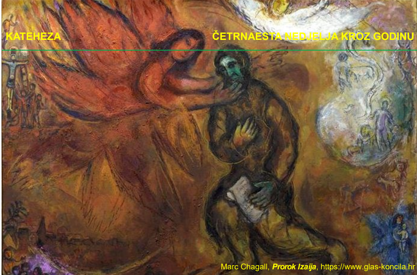
Marc Chagall, Prorok Izaija , https://www.glas-koncila.hr