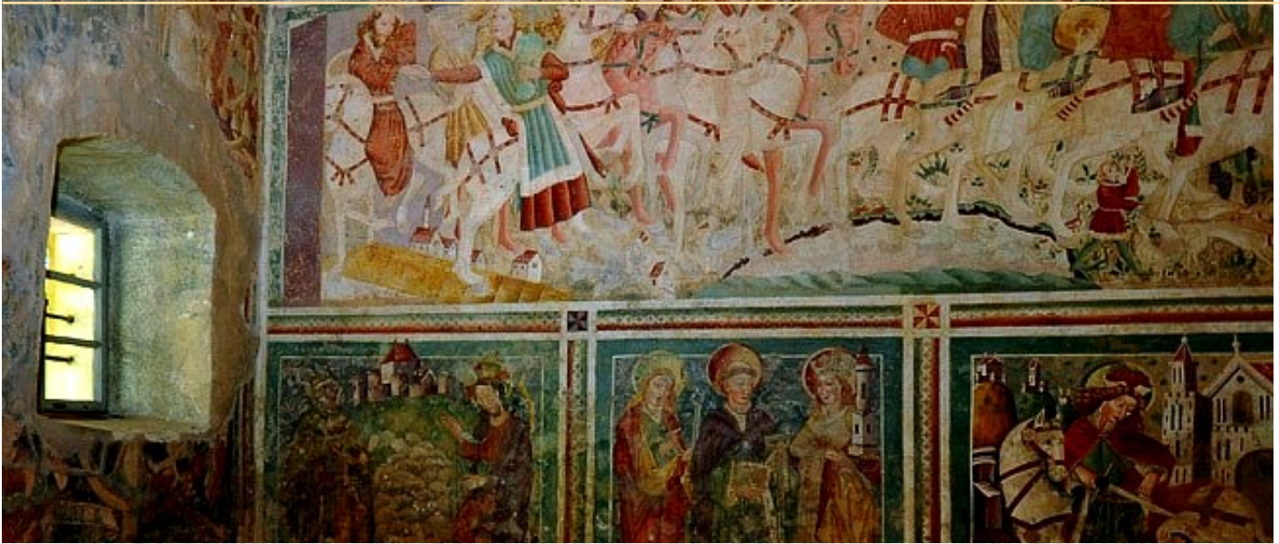
Freska Poklonstvo kraljeva (gornji red) u Crkvi Sv. Marije na Škriljinah

Nije jasno kada i kako je ovo slavlje preraslo u svetkovinu Bogojavljenja u ortodoksnoj, tj. pravoslavnoj Crkvi u Egiptu. Poznato je da je u 4. stoljeću postao blagdan Bogojavljenja u različitim istočnim Crkvama. U svakom slučaju, Bogojavljenje se na Istoku u počecima slavilo kao blagdan Kristova rođenja (pojavka), ali i krštenja u Jordanu.