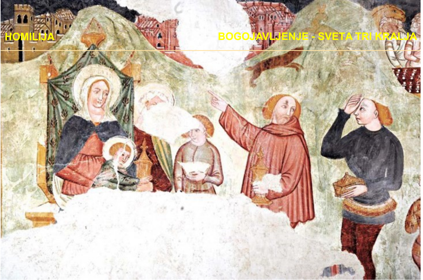
Freska Poklonstvo kraljeva u crkvi svetog Barnaba u Vižinadi

dvoličnost i podlost. Melkior spoznaje da je i sam zaražen time. I da mu to truje život. Žudnja za vlašću, njezina privlačnost i njezin užas, tajna su zbog koje mu cijeli život krvari i trune srce, a ne nalazi ništa što bi ga moglo izliječiti. Sada, u susretu s Djetecom, dobiva rasvjetljenje. Jaslice i dijete u njima svjedoče o snazi slabosti, o neodoljivoj blagosti nenasilnih, o zakonu oprosta. Kraljevstvo Božje ne počiva na sili i strahu, nego na poniznosti i ljubavi. I nije nam dano jednom zauvijek. Polako treba kovati njegov ključ, a taj ključ, to smo mi sami. Odlazeći iz Betlehema, on napušta ideju o zemaljskom kraljevstvu i kreće u potragu za onim koje je obećao Spasitelj. Povlači se u pustinju i osniva zajednicu onih s kojima će, uronjen u molitvu, čekati Njegov dolazak. Zajednica slobodnih ljudi koji poznaju samo jedan zakon - zakon ljubavi.