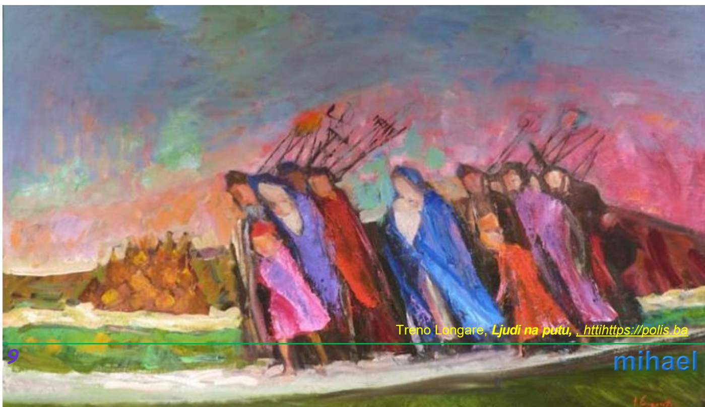
Treno Longare, Ljudi na putu , https://polis.ba