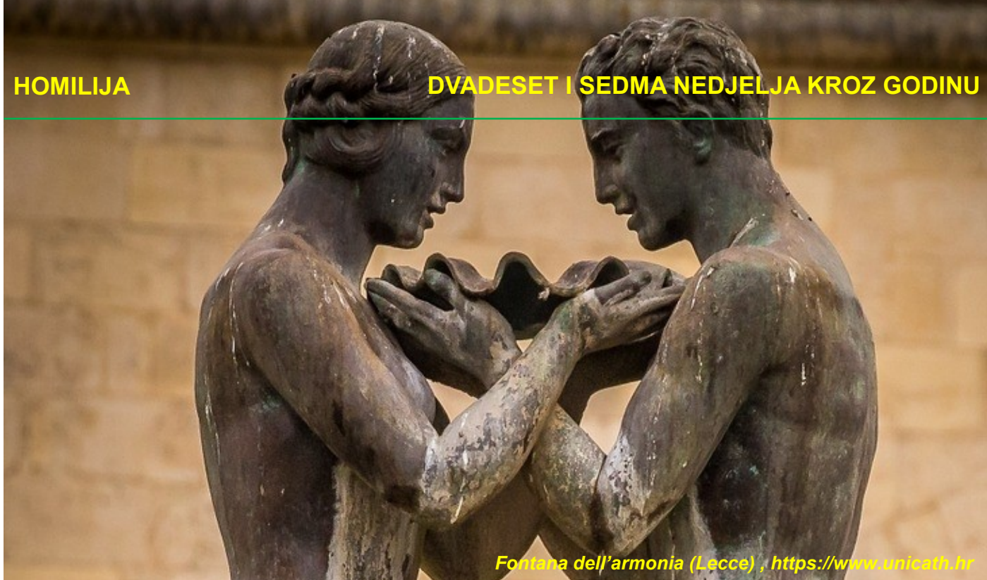
Fontana dell'armonia (Lecce) , https://www.unicath.hr

Ni supruge nisu, naravno, imune od pokušaja nadopunjavanja svoje polovičnosti drugim i sporednim stvarima ili osobama. Nekad to budu prijateljice u koje se ima više povjerenja nego u muža, nekad vlastiti roditelji (posebno majka!) - nekad opet vlastita djeca. U nesposobnosti da ožive zamrlu vezu sa svojim mužem, mnoge supruge traže utočište u djeci. Jedne od njih posvećujući djeci pretjeranu pa time i bolesnu brigu, druge pak uvlačeći ih u svoje sukobe s mužem, dovodeći ih u najgoru zamislivu situaciju za dječju psihu: opredjeljivanje ili za oca ili za majku.