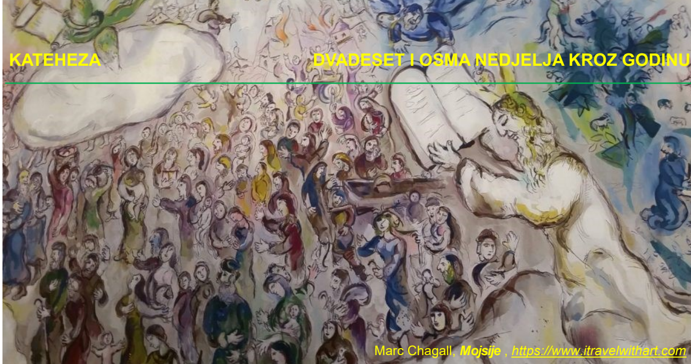
Marc Chagall, Mojsije , https://www.itravelwithart.com

autoreferencijalnoga definiranja vlastitoga Ja u kojem uvijek iznova traži odgovore o svom postojanju i smislu.