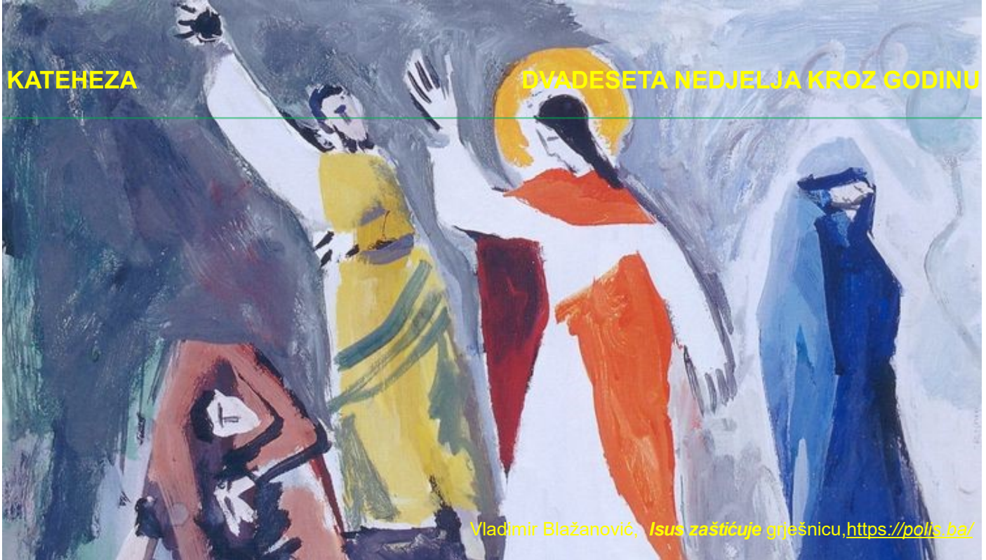
Vladimir Blažanović, Isus zaštićuje grijšnicu , https://polis.ba/

koji sebe drže dobrima, pobožnima i pravednima, a na drugoj ženu koja je imala lošu moralnu sliku u svojoj sredini. Smatrana je javnom grešnicom i ljudi su je izbjegavali.