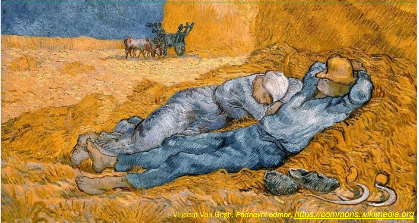
Vincent Van Gogh, Podnevni odmor

Jesi li umoran/na? Jesi li istrošen/na? Jesi li pregorio/la u religiji? Dođi meni. Primakni se meni i zadobit ćeš svoj život nazad. Pokazat ću ti kako se stvarno odmoriti. Hodaj sa mnom i radi sa mnom – gledaj kako to ja radim. Nauči neusiljene ritmove milosti. Neću staviti ništa loše ili teško na tebe. Pravi mi društvo i naučit ćeš živjeti slobodno i rasterećeno. Mt 11,28-30