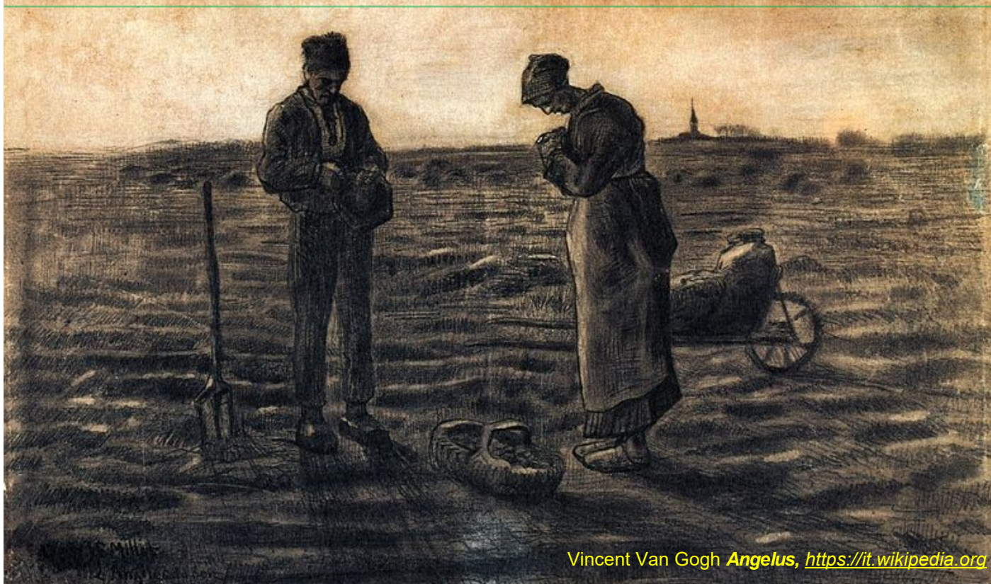
Vincent Van Gogh Angelus

materijalno. Odsječen je od transcendencije, Duha Božjega, od svoje osobnosti i života. Udaljio se od svega što život čini fascinantnim, lijepim i dobrim.