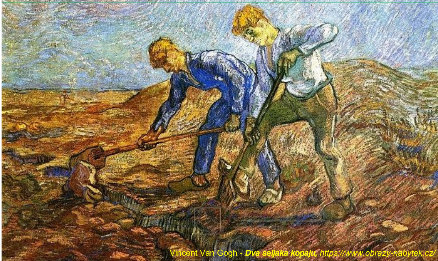
Vincent Van Gogh - Dva seljaka kopaju, https://www.obrazy-nabytek.cz/

Današnja nedjelja donosi nastavak prispodoba o kraljevstvu. Prispodoba iz Evanđelja koju danas čitamo je dosta složena, posebice jer se sastoji od tri prispodobe koje razvijaju različita viđenja o kraljevstvu te sve završava tumačenjem prispodobe o kukolju, stoje i svojevrsni zaključak ovog poglavlja Matejevog evanđelja.