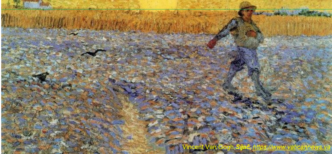
Vincent Van Gogh, Sijač , https://www.vaticannews.va

očišćenje grijeha, s desne strane Veličanstva u nebu.« On objavljuje da je Bog ljubav i ujedno uči da je nova zapovijed ljubavi osnovni zakon ljudskoga savršenstva pa, prema tome, i preobrazbe svijeta. Na temelju te ljubavi osniva svoju zajednicu svetu Crkvu koja je vidljivi i prisutni znak nevidljivoga kraljevstva Božjega čiji se početak čita u Kristovoj krvi i vodi na golgotском križu, kako piše u »Svjetlu naroda«: »Taj početak i rast simbolizirani su krvlju i vodom što su izišle iz otvorenoga boka rassetoga Isusa, i unaprijed naviješteni Gospodinovim riječima o njegovoj smrti na križu: 'I ja ću, kad budem podignut od zemlje, sve privući k sebi.' Kad god se na oltaru obavlja žrtva križa kojom 'je bio žrtvovan Krist naše vazmeno janje, vrši se djelo našega otkupljenja'. Žrtva križa sjeme je koje neprestano niče i donosi plodove. Potreban je sijač sjemena ili propovjednik Božje Riječi.«