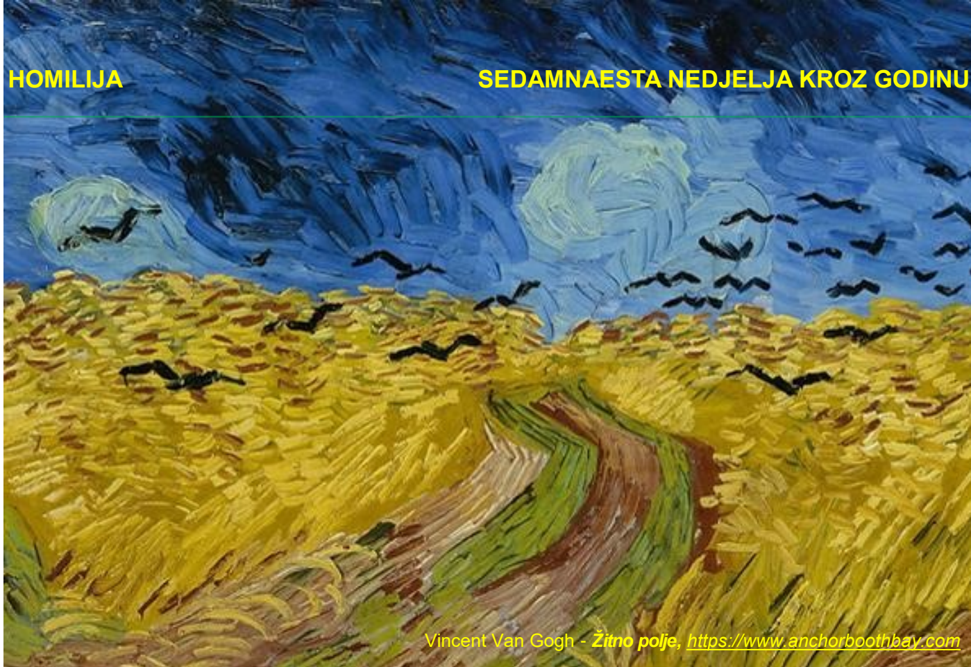
Vincent Van Gogh - Zitno polje , https://www.anchorboothbay.com

prepoznaje i u surovj svakodnevici, posred muka i razapetosti, briga i lomova, posrnuća i izdaja, vlastitih i tuđih grijeha, prisutnost Božjega Duha i njegove spasonosne poticaje prema dobru. Nazočnost Kraljevstva ponajprije se prepoznaje ondje gdje se ljudi pokreću snagom Duha i gdje se ne prepuštaju pogubnoj idolatriji šutnje i slijeganja ramena, gdje dopuštaju da uz njih drugi i drugačiji rastu, gdje se iz vjere u Boga njeguje život i drugima dariva, gdje se ne obožava izvanjske religijske navike, nego se srcem prijanja uz Boga i u svakodnevici tiho i bez probitačnih reklama nastoji podmetnuti leđa oko dobra svih ljudi.