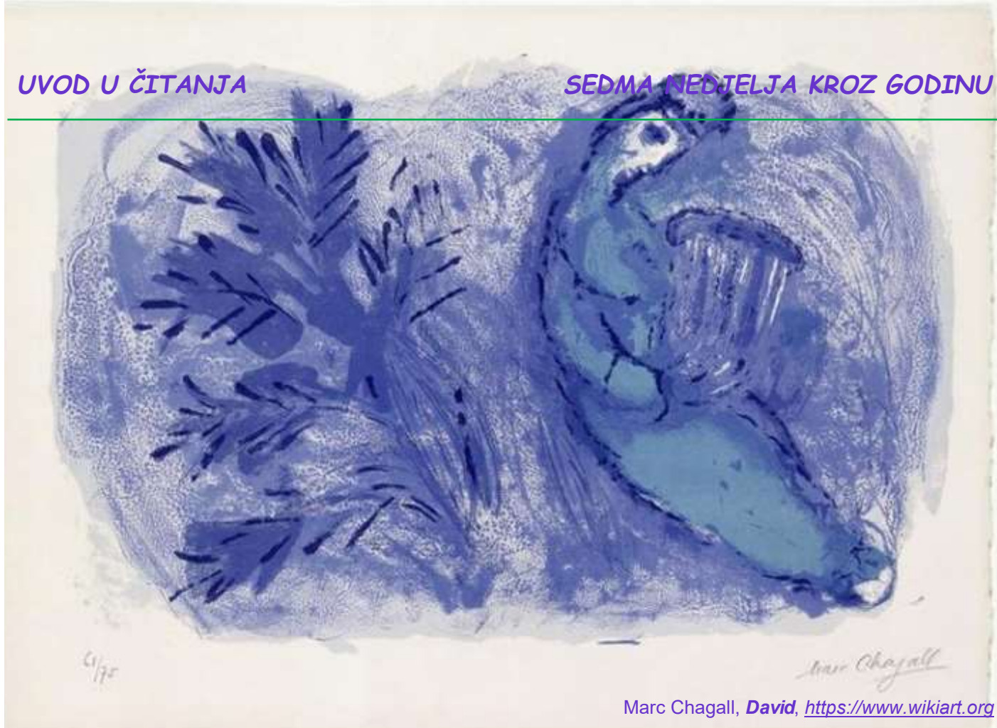
Marc Chagall, David , https://www.wikiart.org

Potaknut vjerojatno progonima prvih kršćana u kojima su progonjeni znali biti i ljuti i u napasti mržnje i osvete prema progoniteljima, ili su bili u napasti prikrivati pripadnost Crkvi, evanđelist donosi Isusove riječi o ponašanju njegovih učenika. Slušateljima odgojenim na starozavjetnom Zakonu odgovaranja istom mjerom, i zapovijedi o ljubavi prema bližnjemu, a mržnji neprijatelja, Isusove riječi zacijelo su zvučale začudno i paradoksalno.