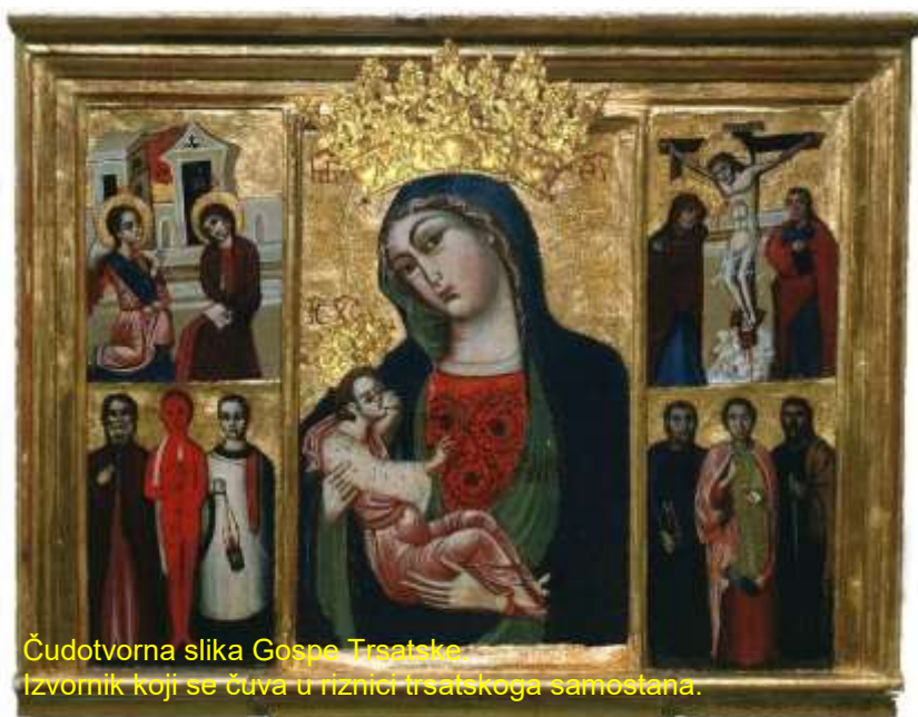
Čudotvorna slika Gospe Trsatske, izvornik koji se čuva u riznici trsatskoga samostana.