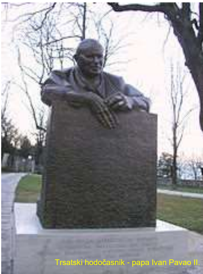
Trsatski hodočasnik - papa Ivan Pavao II.

i molitve upućene sa svih obzora (poklona) s kojih se vidi Trsat ili čuje zvon Marijinog, trsatskog zvonika. Trsatsko svetište su i svi oni lumini, kalendari, slike i molitvenici u domovima vjernika s kojima se upućuju misli Gospi Trsatskoj kao dar iskrene vjerničke pobožnosti, preporuke i zahvalnosti Blaženoj Djevici Mariji za plemenitost i zagovor, za moralnu snagu, vrlinu i nadu, za vjeru... Uzdarje za radost uzora, teškoga ali pravoga puta.