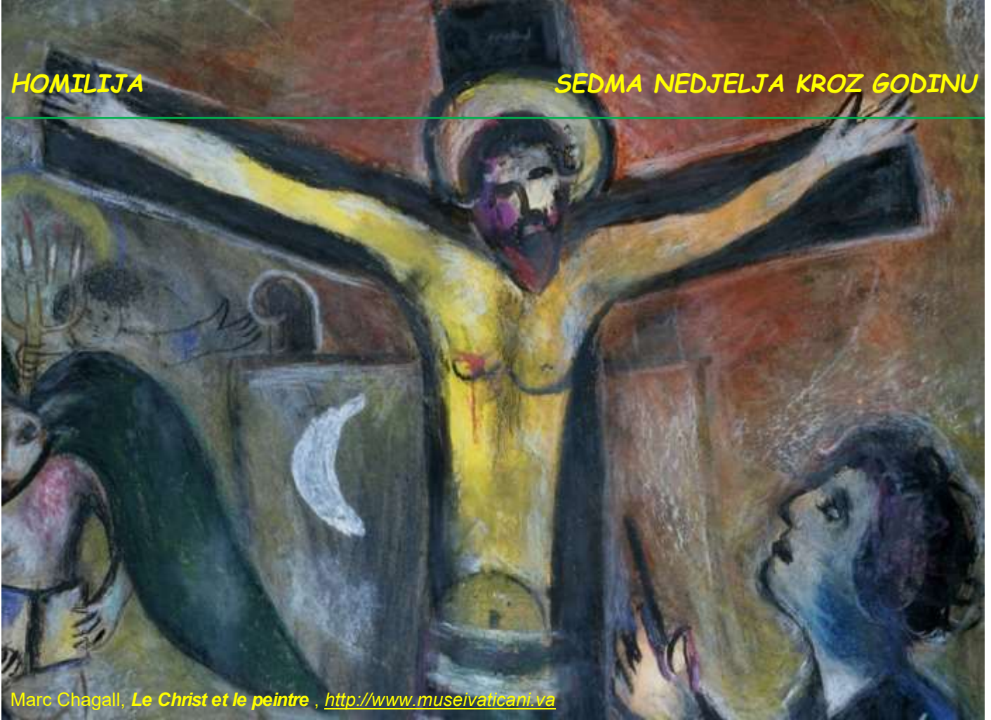
Marc Chagall, Le Christ et le peintre , http://www.museivaticani.va

To nije stav slabića, nego stav snažne osobe: nećeš od mene stvoriti neprijatelja: ovo je upravo suprotno od morala i stava slabića. Ako uzvratim udarcem tada sam totalno neslobodan, reagiram kao drugi, on mene udara, ja onda njega. Ako me netko radosno susreće onda ću i ja njega tako susretati. Sloboda nekog čovjeka leži u tome da može prekinuti taj lanac i da može reći ne gledam te kao svog neprijatelja.