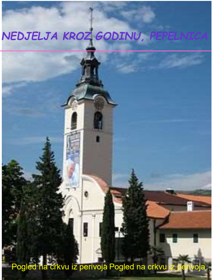
Pogled na crkvu iz perivoja Pogled na crkvu iz perivoja

Trsat je i mornarsko Marijino svetište, svetište Kraljice Jadrana - Zvijezde mora. Odredište mnogih pomoraca i njihovih obitelji, u posvetama, molitvama i zahvalama što ih Gospa "čuva, brani i nanovo sakuplja".