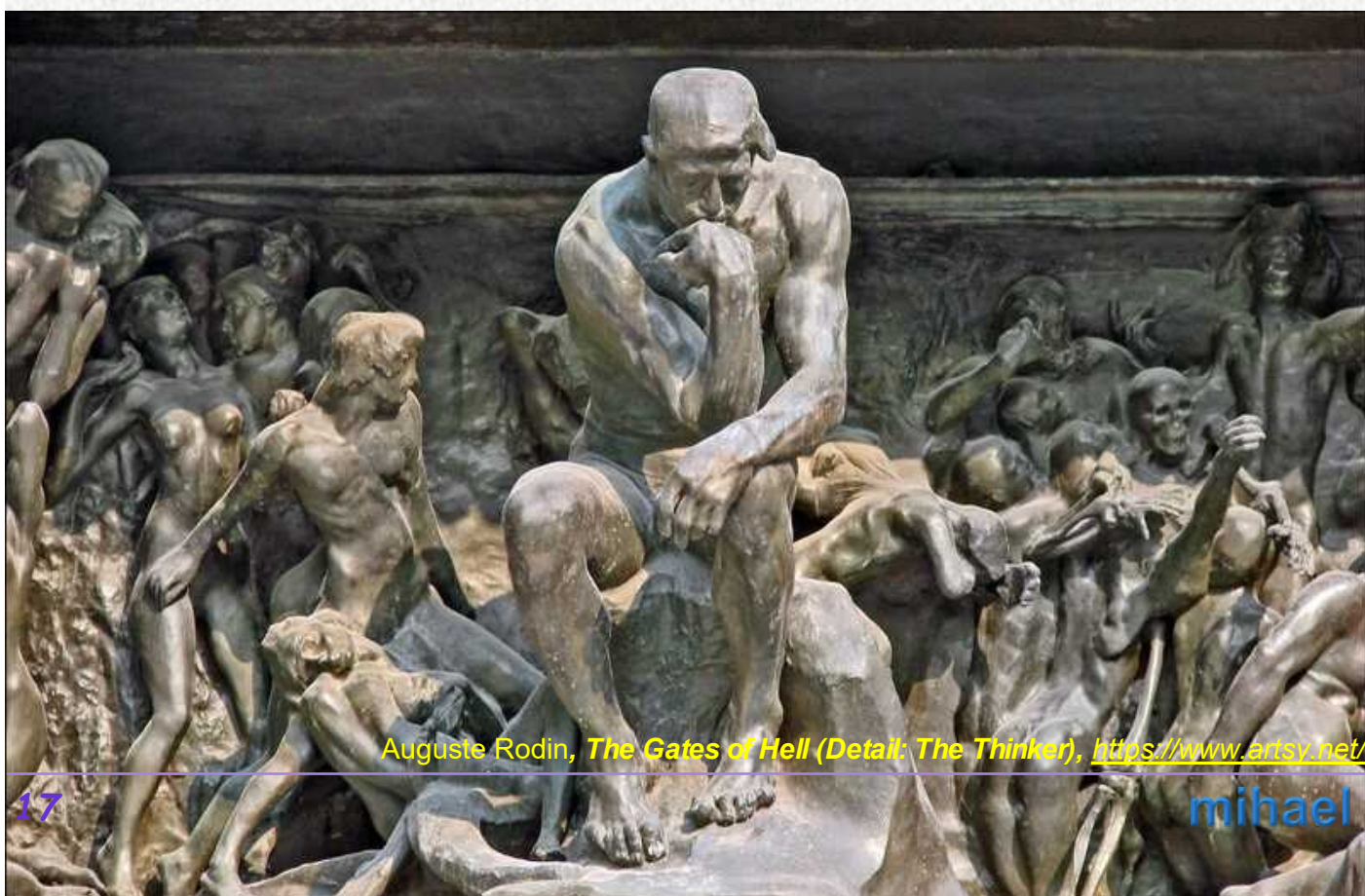
Auguste Rodin, The Gates of Hell (Detail: The Thinker)