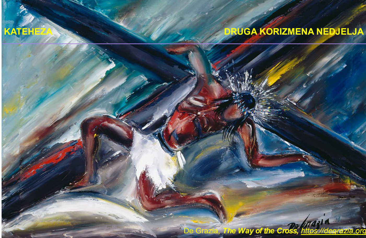
De Grazia, The Way of the Cross , https://degrazia.org

evanđeljima trostruki pad Isusov pod križem (u srednjem vijeku se neko vrijeme govorilo o čak 7 padova). Lik Veronike je nastao iz jedne poslije biblijske legende iz 6. stoljeća. Njeno ime dolazi od latinskog „vera icona” = prava slika. Pripovijest opisuje da je na rupcu kojeg je Veronika pružila Isusu ostala, krvlju otisnuta, prava slika Isusova. I susret Isusa i njegove majke (4. postaja) nama utemeljenja, iako je Marija sigurno stajala pod križem Isusovim (Iv 19,25 sl).