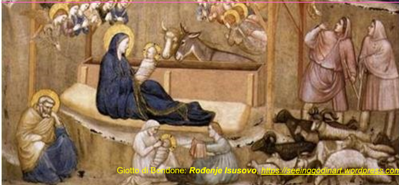
Giotto di Bondone: Rođenje Isusovo

Ćiril Aleksandrijski i Treći ekumenski koncil sabran u Efezu 431. godine ispovjedili su da se „Riječ utjelovila, sjedinivši hipostatski sa sobom tijelo oduhovljeno razumnom dušom“. (Efeški koncil, Epistula Cyrilli Alexandrini ad Nestorium: DS 250. ) Kristovo čovještvo nema drugoga subjekta nego božansku osobu Sina Božjega koja ga je, u trenutku njegova začeća, uzela i učinila svojim. Zato je Efeški sabor 431. godine izjavio da je Marija ljudskim začetom Sina Božjega u svom krilu uistinu postala „Bogorodicom, ne zato što bi narav Riječi ili njezino boštvo imalo početak svoga bitka iz svete Djevice, nego jer je od nje rođeno sveto tijelo obdareno razumskom dušom, s kojim se hipostatski sjedinila Riječ, te se kaže da je i rođena po tijelu“. (Efeški koncil, Epistula Cyrilli Alexandrini ad Nestorium: DS 251. )