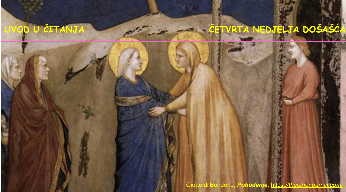
Giotto di Bondone, Pohodnje , https://theotherjournal.com/

to čine pred samim Bogom. Otrprike u vrijeme nastanka Poslanice Hebrejima, Rimljani su razorili Jeruzalem, uništili Hram i protjerali svećenike. Zbog toga se pojavljuju ljudi koji hramsko bogoslužje proglašavaju besmislenim i neučinkovitim.