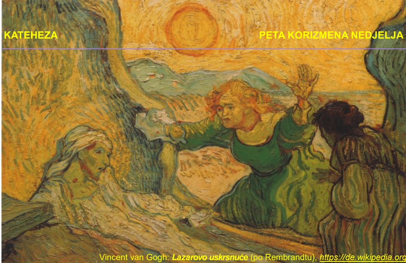
Vincent van Gogh: Lazarovo uskrsnuće (po Rembrandtu)

ne mogu poći na sprovod. Treći se izgube tjednima poslije sprovoda. Svjesni smo da čovjek i ljudska pamet mogu samo do groba, ali dalje ne. Znanost i tehnika stanu pred grobom. Preko smrti i iznad smrti može samo Božja ljubav.