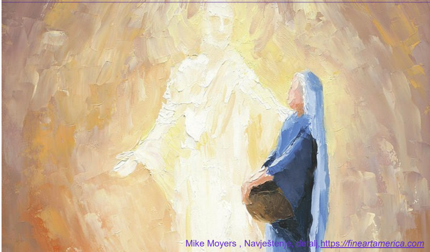
Mike Moyers , Navještenje, detalj https://fineartamerica.com

Utjelovljenje Sina Božjega govori o potpunom prihvaćanju čovjeka. Ljudski život nije preuzet samo u prividu ili u nekom njegovom dijelu, nego u cjelovitosti.