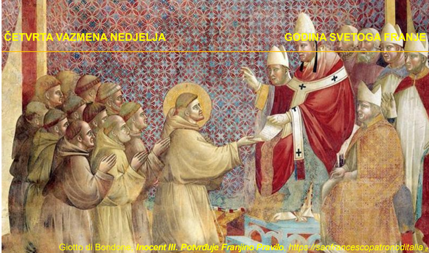
Giotto di Bondone, Innocent III. Potvrđuje Franjino Pravilo . https://sanfrancescopatronoditalia.it

meditira, moli. Svi primjećuju promjenu njegova života. Zaokupljen je mislima kako služiti jedinom Gospodaru?