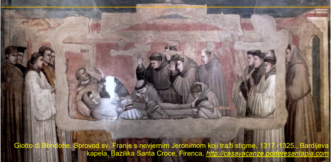
Giotto di Bondone, Sprovod sv. Franje s nevjernim Jeronimom koji traži stigme, 1317.-1325., Bardijeva kapela, Bazilika Santa Croce, Firenca