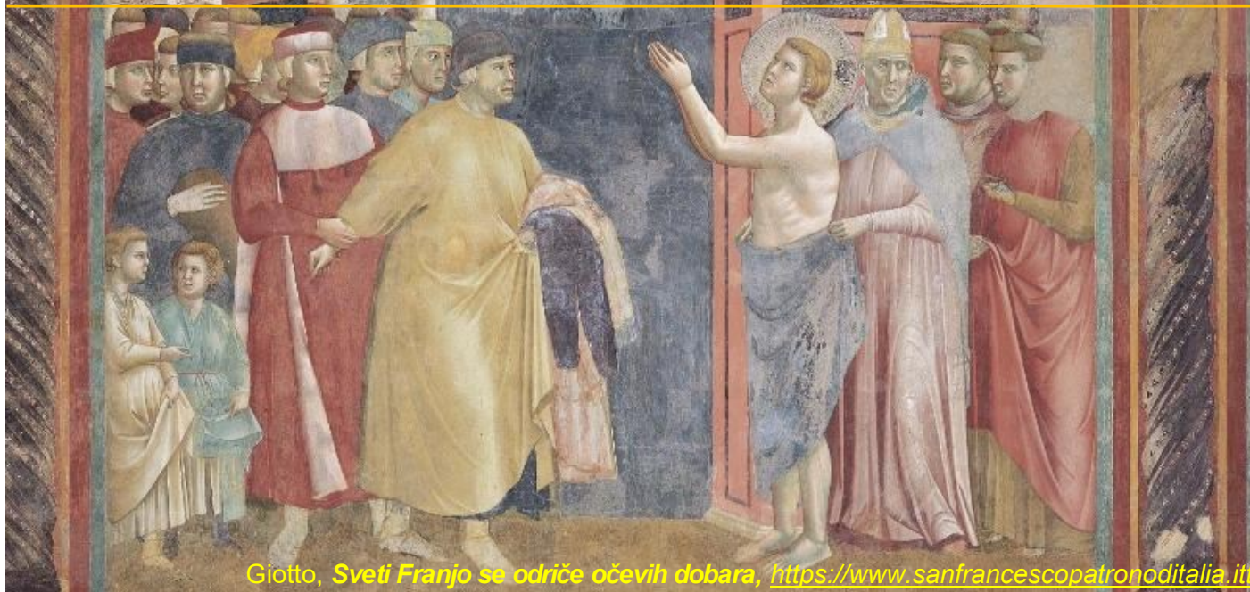
Giotto, Sveti Franjo se odriče očevih dobara , https://www.sanfrancescopatronoditalia.it

Sveti je Franjo Asiški svetac Katoličke Crkve o kojemu se najviše piše i govori. On je čovjek koga je Bog poslao da popravi ne samo nesređeno stanje u društvu i Crkvi svoga vremena nego također i kršćansko društvo svih vremena. Božja ga je providnost dala i poslala u svijet. Dosada nije bilo nijednog čovjeka u kome se življe i vjernije odražava slika Krista Gospodina i evanđeoski način življenja negoli u Franji Asiškom (Pio XI.).