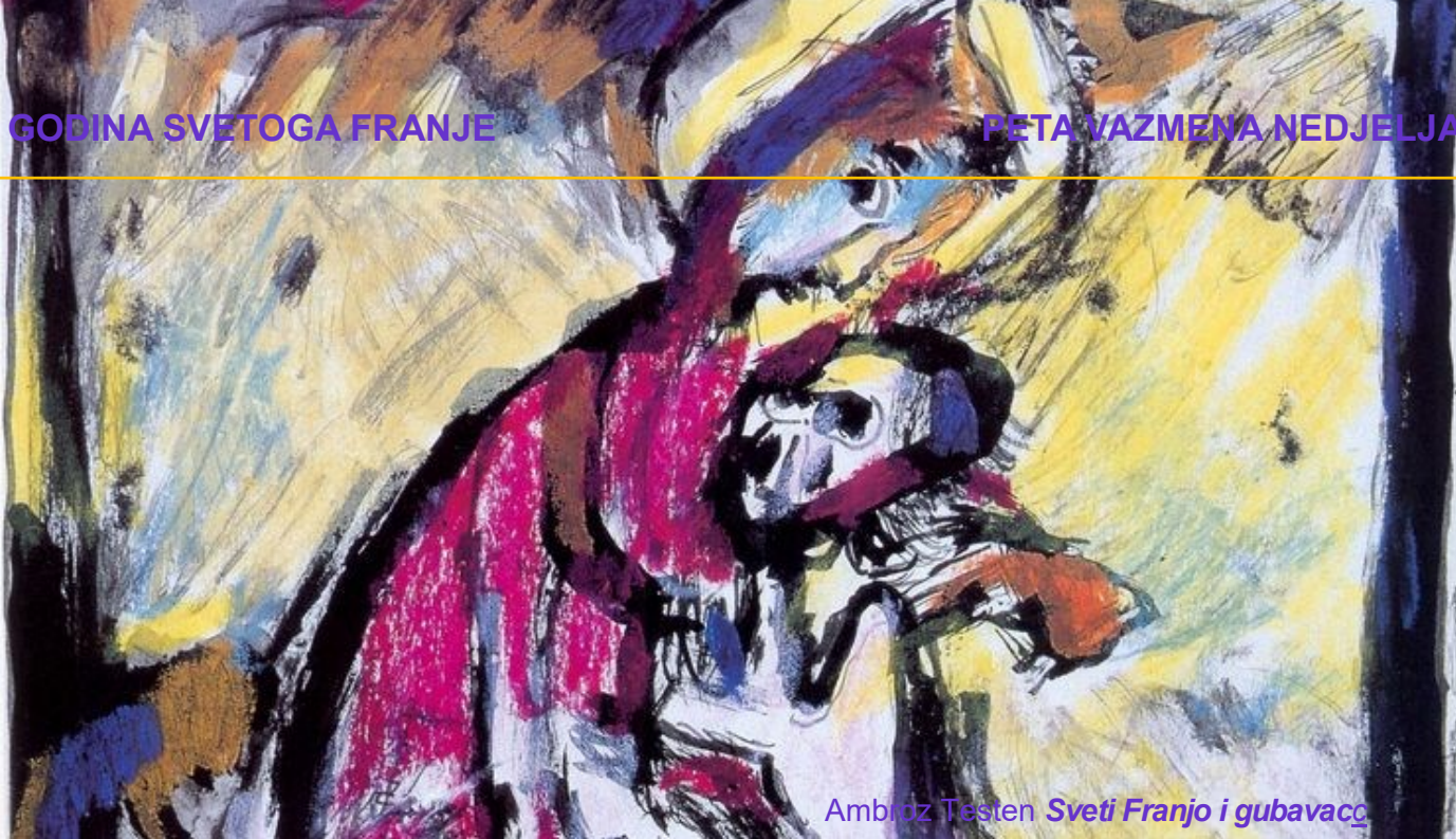
Ambroz Testen Sveti Franjo i gubavac

Grad je radilište u kojem se, podjelom rada, razvijaju brojni i raznoliki zanati. Na putu „industrijalizacije“ u tri se sektora, graditeljstvu, suknarstvu i kožarstvu, rađa manufakturni pred-proletarijat bez zaštite od podređenosti „pravedne plaće“ „poštenoj cijeni“ - cijeni što je ponudom i potražnjom određuje tržište - i bez zaštite nasuprot dominaciji „poslodavaca“.