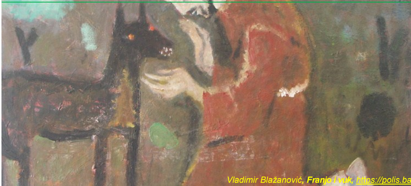
Vladimir Blažanović, Franjo i vuk , https://polis.ba

život. Pa i ako - usprkos razdorima i sukobima - ostaje vjeran Crkvi iz poniznosti i po dubokom štovanju sakramenata čije je dijeljenje zahtijevalo jedno tijelo različitih i respektiranih službenika, on ipak u svome bratstvu, i koliko je moguće u počecima Reda, značajno odbacuje hijerarhijski ustroj i prelaturu. U tom svijetu u kojem se javlja tijesno povezana bračna i agnatska obitelj (osobe u građanskopravnom srodstvu nap. ur.) ali u kojem antifeminizam ostaje temeljna oznaka i u kojem vlada velika ravnodušnost prema djeci, Franjo, svojim vezama s nekoliko bliskih žena, ponajprije sa svetom Klarom i svojim oduševljenjem djetetom Isusom u jaslicama Greccija, pokazuje svoju bratsku pozornost prema ženi i djeci.