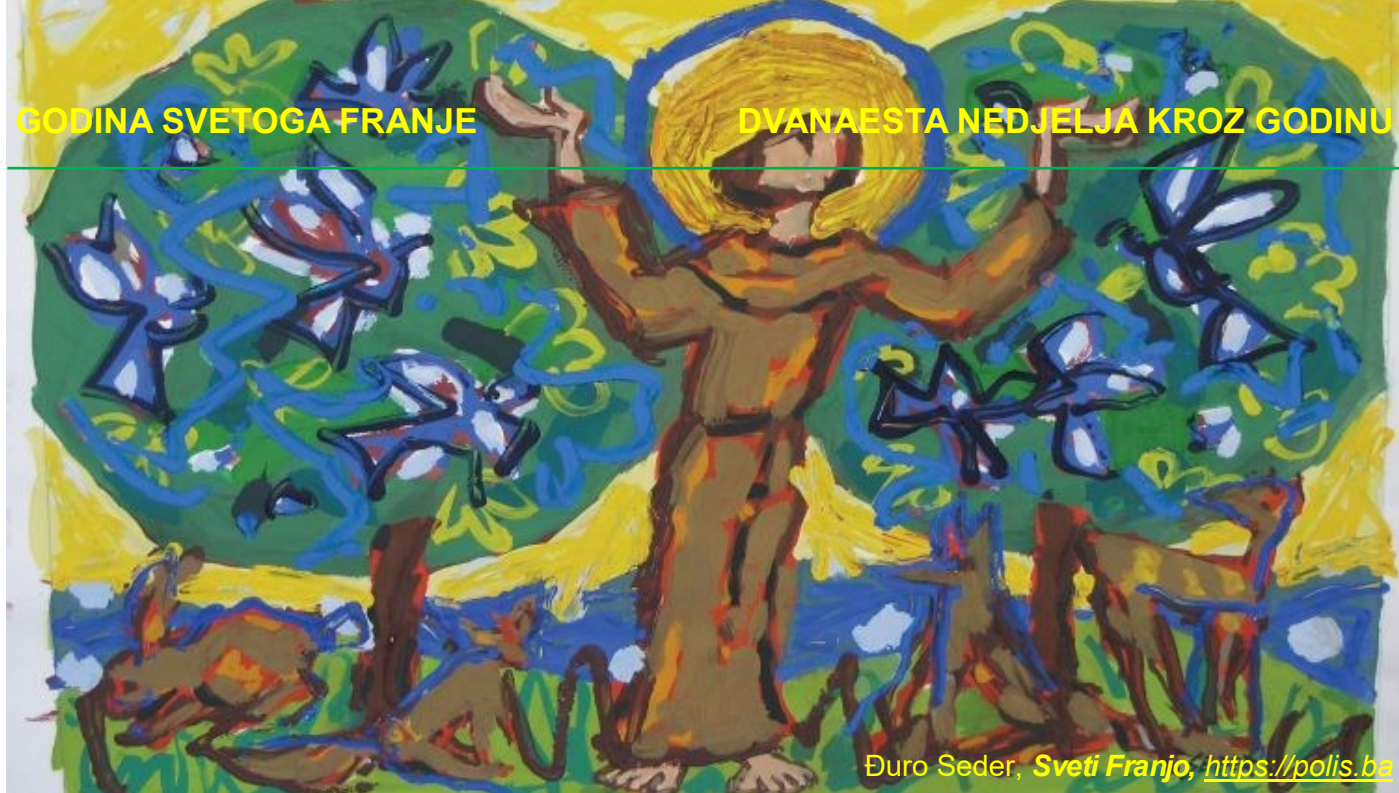
Duro Seder, Sveti Franjo

dva svrstala uprave redovnike, poslušne jednom pravilu, dok je treći sačinjavao ono što se nazivalo „vrstom trećeg reda ante litteram “ koji se bavio zanatskim poslovima kako bi novčano podmirio svoje potrebe i imao što dati siromašnima. Na isti način Inocent III. je u Pismu razlikovao dvije vrste tekstova: aperta - narativne i moralne epizode pristupačne svima i profunda - dogmatska izlaganja čije je razumijevanje i tumačenje bilo pridržano klericima.