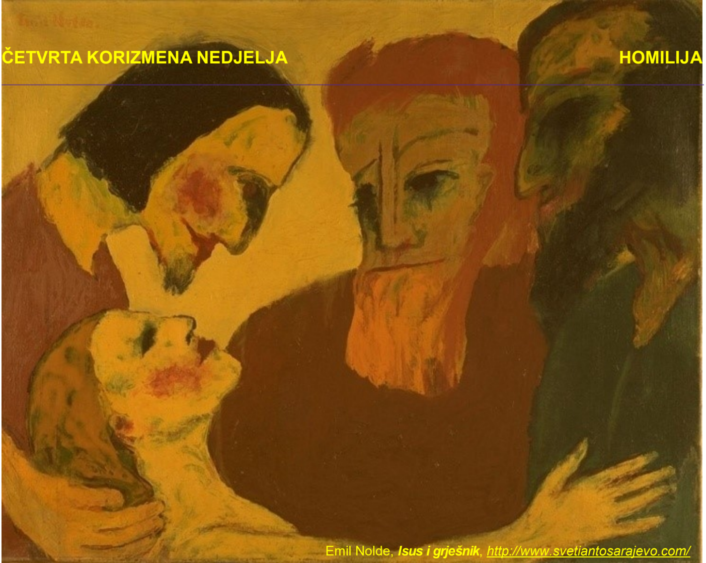
Emil Nolde, Isus i grješnik , http://www.svetiantosarajevo.com/