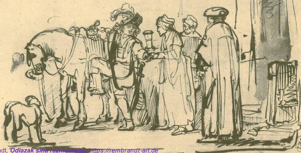
Rembrandt, Odlazak sina razmetnoga , https://rembrandt-art.de

čega se mogao odlučiti vratiti svome ocu i priznati „Oče! Sagriješih protiv Neba i pred tobom!“. Naša pozornost često je usmjerena na čovjeka i ljudsku zajednicu. Zbog toga nam promiče spominjanje grijeha protiv Neba. Sinovljevi postupci pokidali su ne samo društveno tkivo, već i ekološko - njegov odnos s bližnjima, sa samim sobom, ali i s ostalim stvorenjem. Sve to morat će se obnoviti.