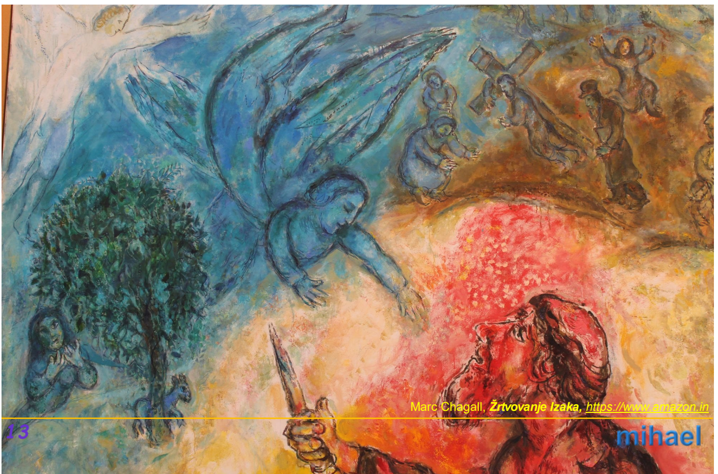
Marc Chagall, Žrtvovanje Izaka , https://www.amazon.in

„Evo kremen a i drva“, opet će sin, „ali gdje je janje za žrtvu paljenicu?“