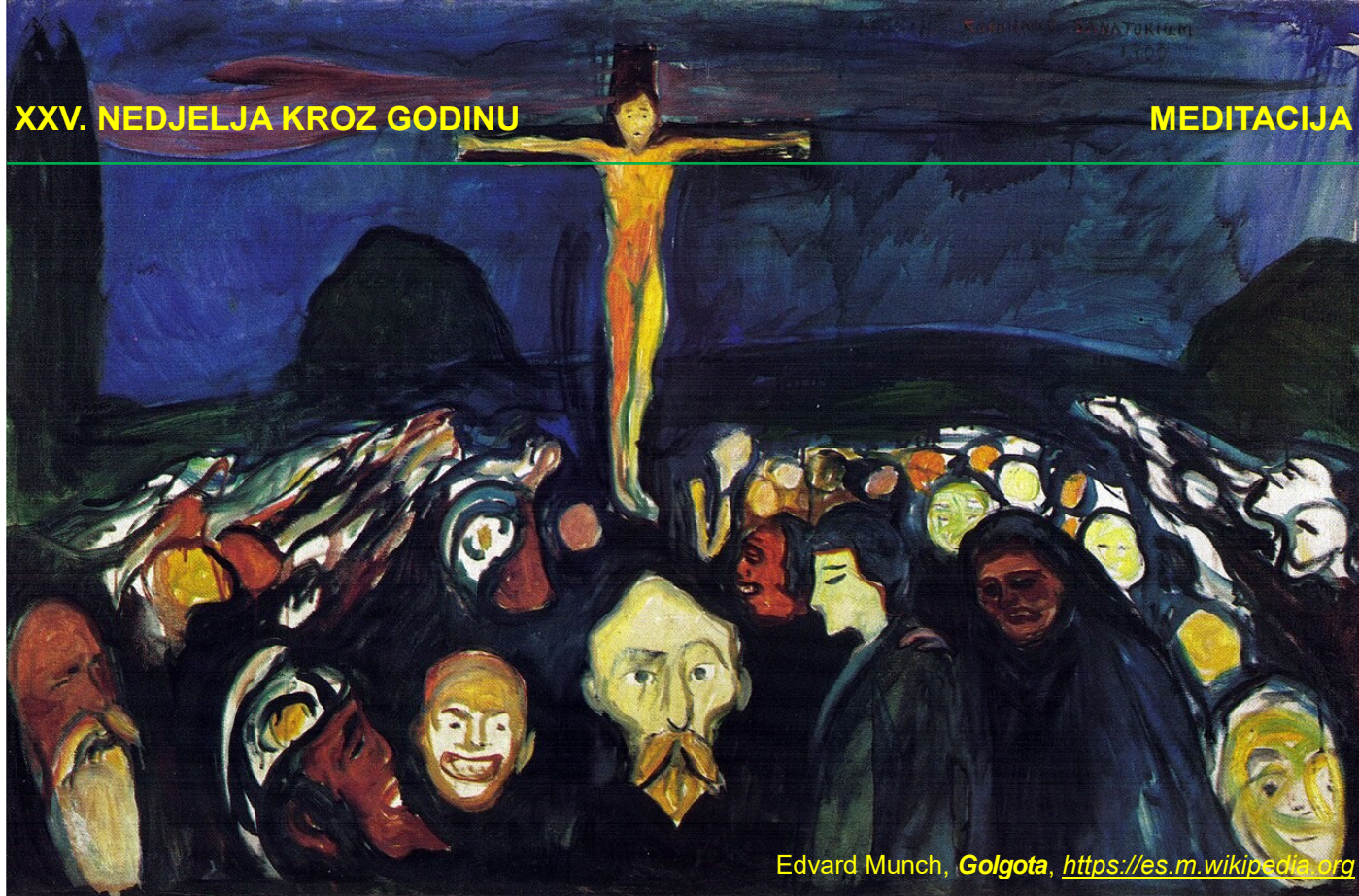
Edvard Munch, Golgota , https://es.m.wikipedia.org