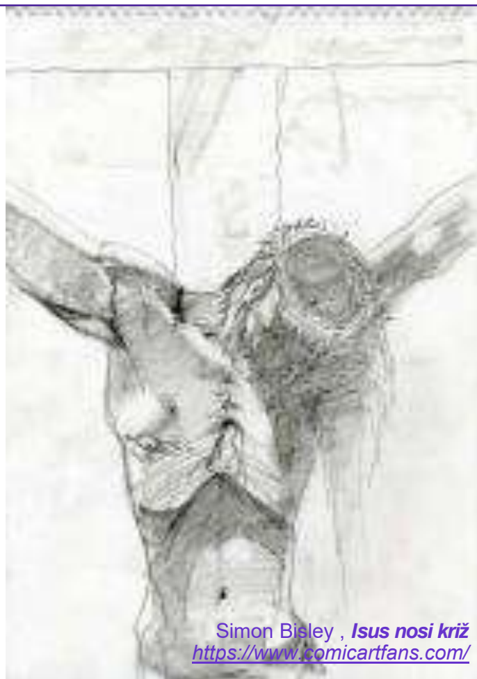
Simon Bisley , Isus nosi križ https://www.comicartfans.com/

Da, ti si dovršio. Dvršen je nalog što ti ga je dao Otac. Ispijena je čaša koja te nije smjela mimoći. Pretrpio si strašnu smrt. Dvršeno je otkupljenje svijeta. Pobjeđena je smrt. Svladan je grijeh. Nemoćna postade moć duhova tame. Otvorena su vrata života. Zadobivena je sloboda djece Božje. Sada može puhati Duh milosti. I već se počinje polako, kao u praskozorje, rumeniti mračni svijet u žaru tvoje ljubavi, i samo jedan mali trenutak - mali trenutak što ga zovemo povijest svijeta - i on će se zapaliti i zažariti i biti vatra tvoga božanstva, i sav će svijet biti uronjen u blaženo ognjeno more tvoga života. Sve je dovršeno.