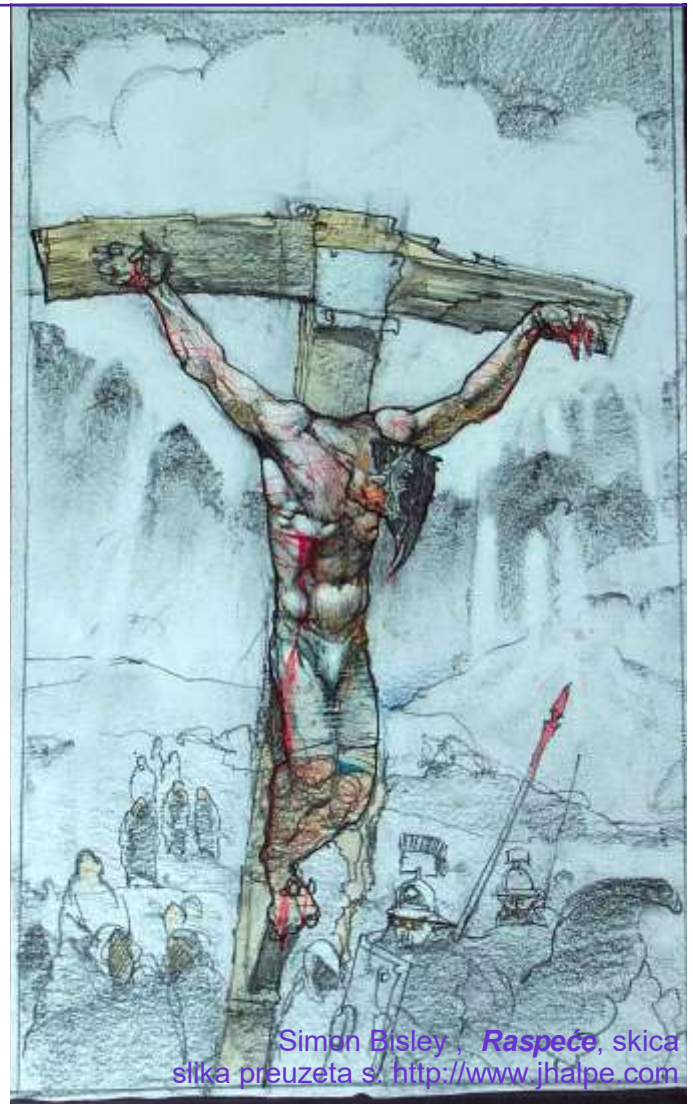
Simon Bisley, Raspeće , skica slika

O Slugo Očev, poslušan do smrti, smrti na križu, ti se ne obazireš na ono što te je zadesilo, nego gledaš na sve ono što te ima još zadesiti, ne gledaš na ono što činiš, nego što ti je činiti, ne gledaš na činjenice, nego na dužnost. Kao da bojažljivo paziš - još i u smrtnom strahu, što smućuje duh i lišava prisebnosti - kako bi se sve u tvome životu uskladilo s vječnom slikom, koja je stajala u duhu tvoga Oca, kada te je mislio. Tako se ti, zapravo, ne obazireš na nečuvenu žeđ svog iskrvavljenja, živim ranama pokrivena golog tijela, koje je izloženo vrelom istočnjačkom suncu. Naprotiv, ti utvrđuješ - jer do smrti ljubiš Očevu volju - s poniznošću: da, i to je ispunjeno, to što su o meni navijestila proročka usta kao Očevu volju; da, zaista sam žedan. O kraljevsko srce, komu je i patnja, što ludim bijesom prži tvoje tijelo, samo ispunjenje naloga odozgo!