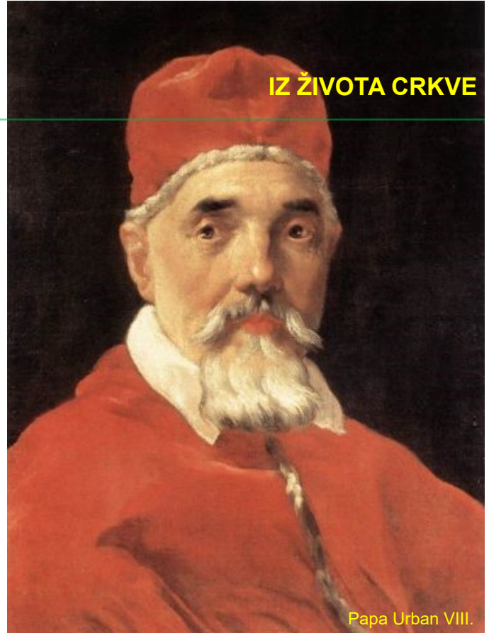
Papa Urban VIII.

Kodifikacija zakonitosti hrvatskoga jezika obavljena je već u prvoj polovini XVII. st. , ali ne - kao u drugih naroda - na samom njegovu izvorištu, nego - stjecajem povijesnih okolnosti - u papinskom Rimu. Hrvatska je - kao što znamo - u to doba bila raskomadana na četiri različite i međusobno sukobljene države (Tursko carstvo, Austrijsku monarhiju i na dvije republike, Mletačku i Dubrovačku). Razumljivo, u takvim okolnostima se nije moglo ni pomišljati na stvaranje jedinstvenoga jezika i njegovo ozbiljnije proučavanje. To je bilo moguće samo u Rimu, s čijih se brežuljaka moglo vidjeti mnogo dalje nego s naših planina i gdje se uvijek znalo razmišljati u univerzalnim kategorijama, naročito nakon velikih geografskih otkrića krajem XV. i početkom XVI. st. kada je svijet prvi put u svojoj povijesti - barem u geografskom pogledu - postao jedan i jedinstven. Trebalo je, po zamisli Katoličke crkve, raditi ne samo na upoznavanju, nego i zbližavanju starih i novih naroda i kontinenata. Taj je zadatak bio povjeren misionarima koji su se razišli po cijelom golemom području od