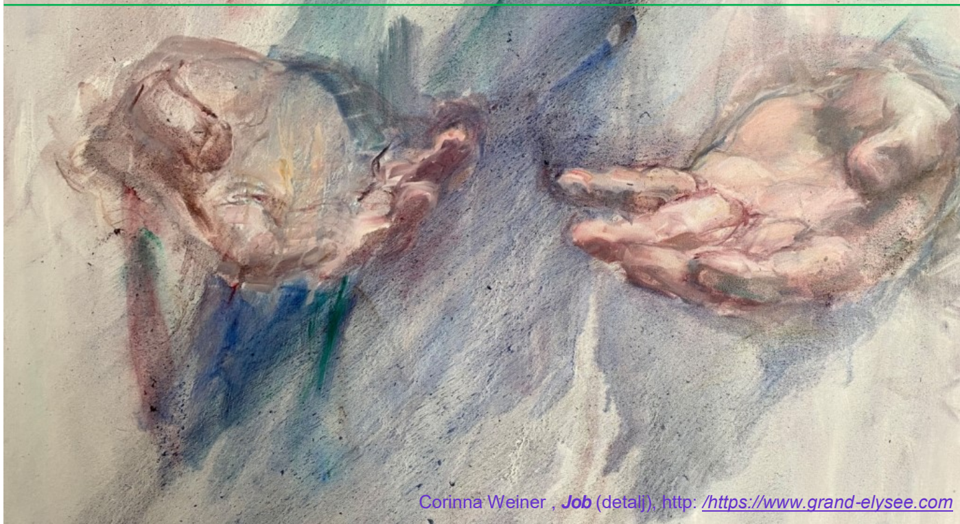
Corinna Weiner , Job (detalj), http: /https://www.grand-elysee.com

patnji. Naime, cijela je Knjiga posvećena patnji. Knjiga o Jobu. Divni primjer podnošenja patnje. Imamo lijepi primjer pouzdanja u Božju volju.