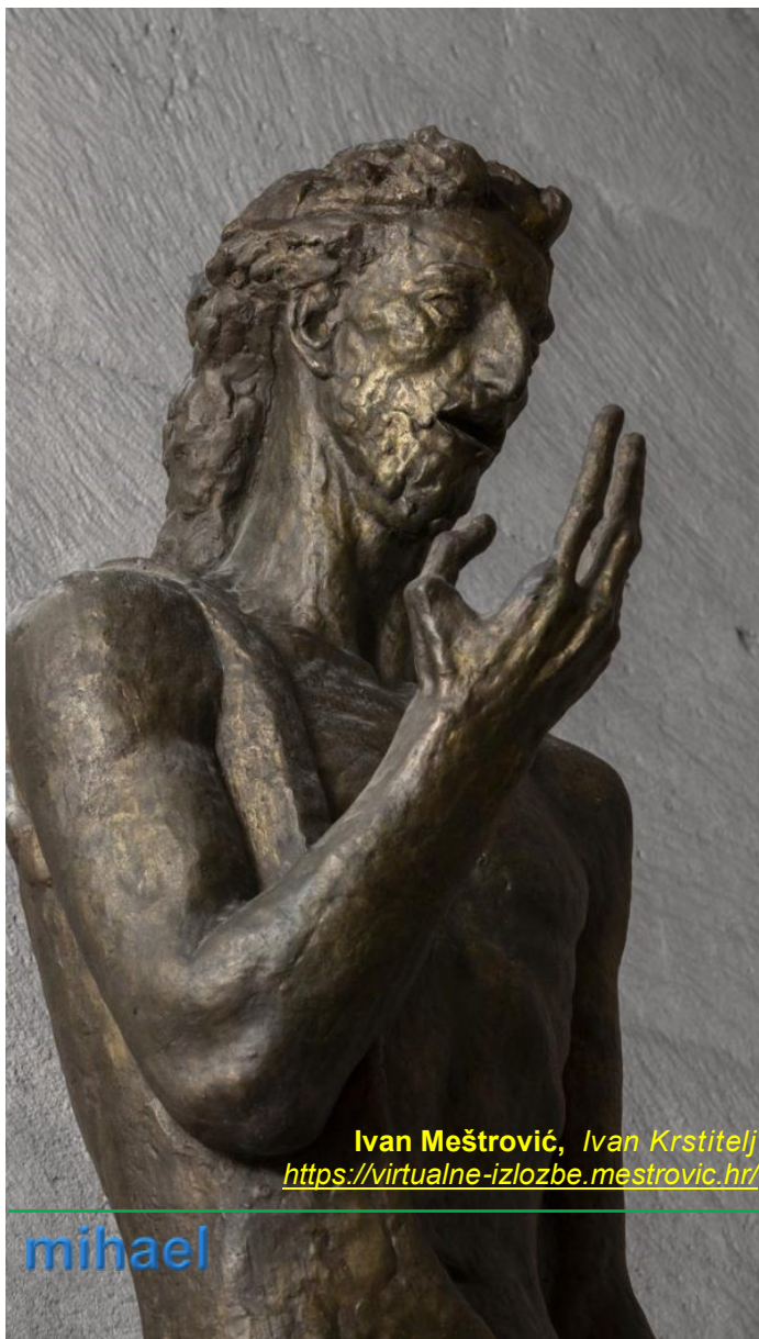
Ivan Meštrović, Ivan Krstitelj https://virtualne-izlozbe.mestrovic.hr/

Kao jedini među svecima, pored Marije, Ivan Krstitelj se liturgijski slavi i na svoj rođendan. Isus je o njemu rekao: „Između rođenih od žene ne usta veći od Ivana Krstitelja“(Mt 11,11).