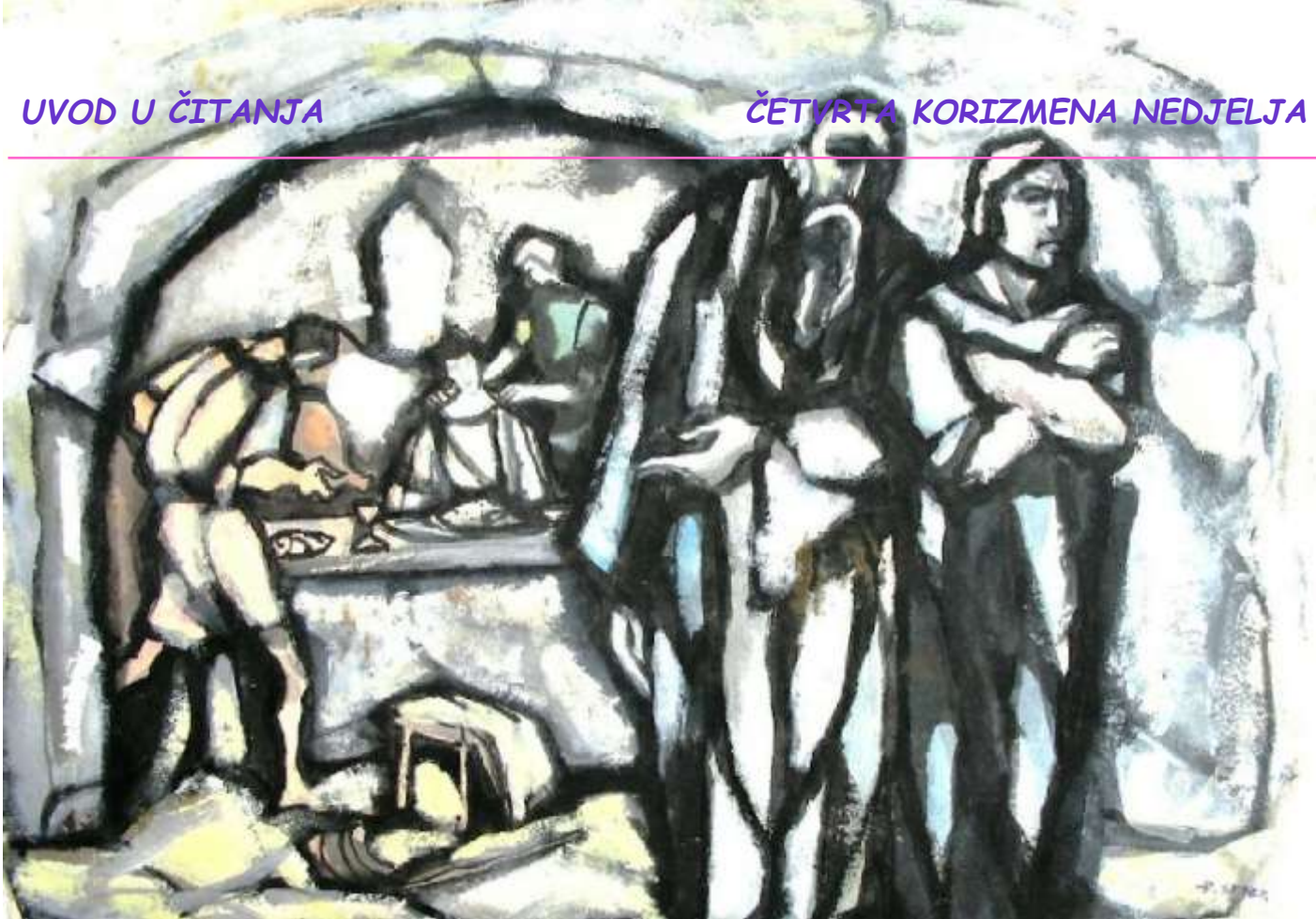
Duro Seder, Otac i stariji sin , Zbirka Žeravac, http://www.svetiantosarajevo.com

P rispodobom o ocu i sinovima Isus odgovara kritičarima zašto se druži s grešnicima istodobno ukazujući na veličinu Božjeg milosrđa i opasnost od uljuljanosti u sigurnost vlastite ispravnosti, te neizravno postavlja pitanje i daje jasan odgovor njihovog mjesta u priči.