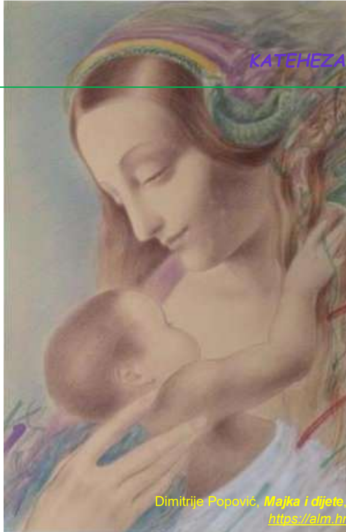
Dimitrije Popović, Majka i dijete , https://alm.hr

29. Ovim pogledom vjere i ljubavi, milosti i vjernosti promatrali smo odnos između ljudske obitelji i božanskog Trojstva. Božja riječ kazuje nam da je obitelj povjerena muškarcu, ženi i djeci da tvore zajednicu osoba koja će biti slika jedinstva između Oca, Sina i Duha Svetoga. Rađanje i odgoj djece odraz je Očeva djela stvaranja. Obitelj je pozvana svakodnevno se okupljati na molitvu, čitati Božju riječ i sudjelovati u euharistijskom